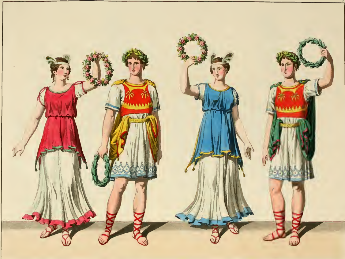
Weibliche und männliche Herodalen